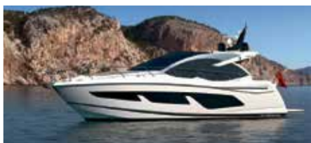
Sunseeker 50 Predator