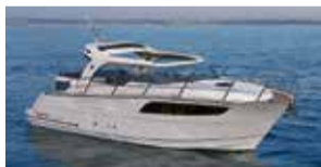
Marex 320 Aft Cabin Cruiser