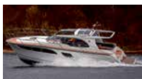
Marex 360 Aft Cabriolet Cruiser

Seuraavat veneet myös heti valmiina, esillä myymälässämme myös näyttelyn ajan.