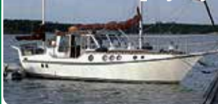
Ansö 31 moottoripurjehtija

Teräs, hienokuntoinen ja hyvinvarusteltu. 23.800 €