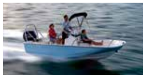
Boston Whaler 170 Montouk