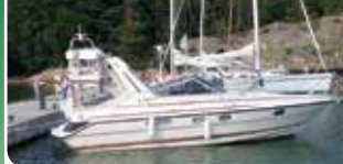
Princess 266 Riviera

Volvo Penta KAD 44, 260 hv -99. Hieno ja varusteltu. 44.000 €