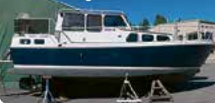
Teräsvene Jukson 9000-89

2 x Caterpillar 420 hv -98. HIENO ja ISO jahti. Tuoreesti huippuvarusteltu. 73.000 €