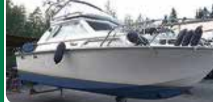
Coronet 24 Family Flybridge

Yamaha 240 hv diesel -97. Hienokuntoinen ja harvinainen. 24.400 €