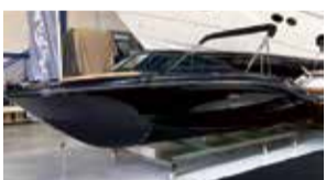
Sea Ray 21

Nämä veneet mukana Uivassa venenäyttelyssä, heti valmiina!