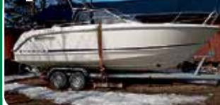
Aquador 25 WA

Volvo Penta KAD 43, 230 hv -03. Siisti ympärikäveltävä. 42.000 €