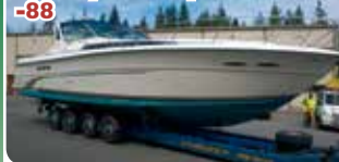
Sea Ray 390 Express Cruiser -88

2 x Caterpillar 420 hv -98. HIENO ja ISO jahti. Tuoreesti huippuvarusteltu. 73.000 €