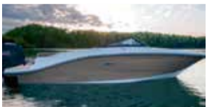
Sea Ray 190 SPOE

Seuraavat veneet myös heti valmiina, esillä myymälässämme myös näyttelyn ajan.