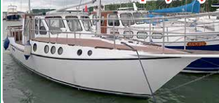
Ansö 3 I moottoripurjehtija

Teräs, hienokuntoinen ja hyvinvarusteltu. 19.900 €