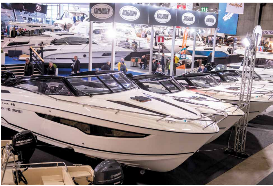
Venemessuilla on helppo tehdä omakohtaista vertailua veneiden välillä.

V ene 20 Båt -messut on Pohjois-Euroopan suurin venemessutapahtuma, jossa vierailee vuosittain kymmenen päivän aikana yli 65 000 veneilijää ja vesillä liikkujaa. Mukana on yli 300 näytteilleasettajaa. Veneilijöille tarjotaan messuilla tietoa veneilystä, veneen valinnasta, veneiden huoltamisesta, veneilykohteista ja -mahdollisuuksista. Purjehdussatamassa kuullaan purjehdustarinoita ja saadaan tietoa Itämeren tilanteesta.