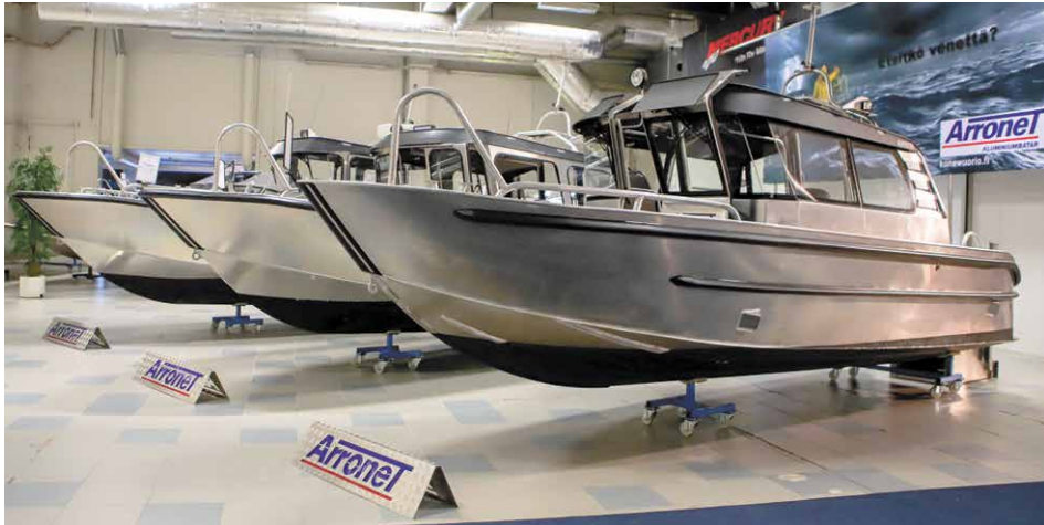
Astrum Veneen tiloissa Salossa on näytillä kattava valikoima eturivin venemerkkejä ja -malleja.