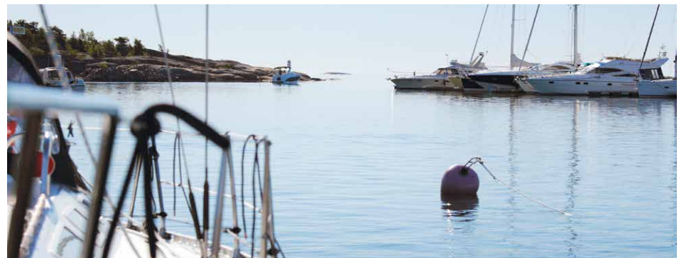
Saariston Satamat -Facebook ryhmään liittymällä kuulee nopeasti viimeisimmät vierasvenesatamien kuulumiset. Kuvassa Suomen vilkkain vierassatama eli Hangon vierasvenesama.

www.facebook.com/groups/saaristonsatamat