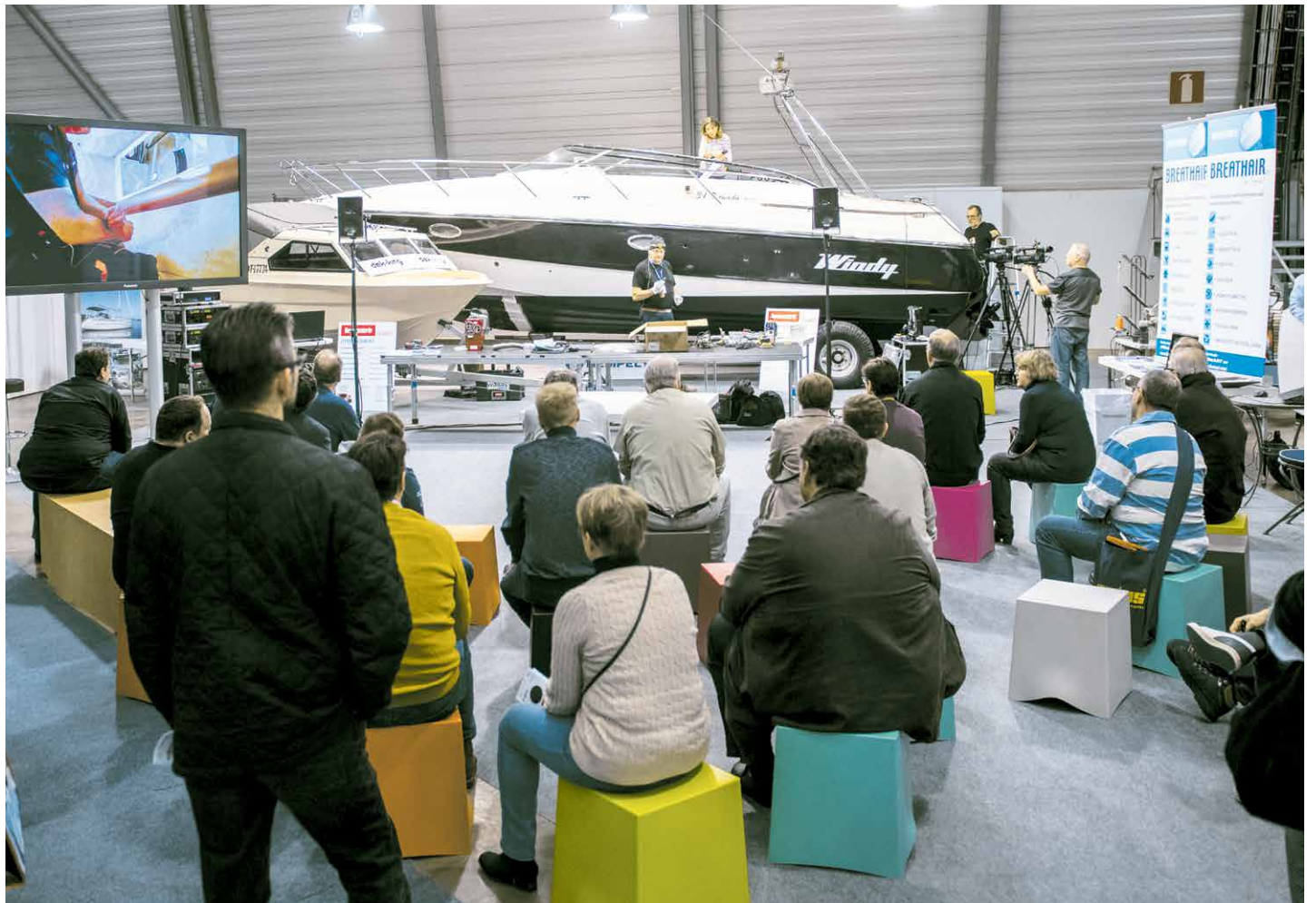
Venemestari Telakan ohjelma koostuu veneen ylläpitoon, huoltoon ja hoitoon liittyvistä työnäytöksistä ja esityksistä.