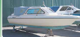
Scantec 580 HT