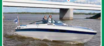
Chris Craft 26 Scorpion

GM Vortec 5, 7 l, 300 hv, moottori uusit- tu 2006. 18.900 €