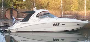
Sea Ray 395 DA

2 x Cummins a`380 hv + ZEUS -08. VAIN 370 t. HIENO ! 249.000 €