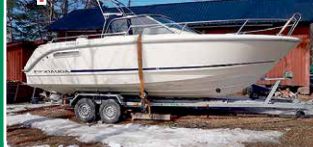
Aquador 25 WA

Volvo Penta KAD 43, 230 hv -03. Siisti ympärikäveltävä. 42.000 €