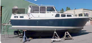
Terasvene Jukson 9000 -89

Yanmar 8LP, 370 hv. -17 !! Hieno vene tuoreella tekniikalla. 112.000 €