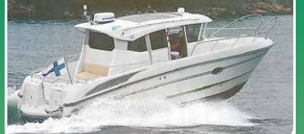
Grandeza 28 WA -07

Yanmar 8LP, 370 hv. -17 !! Hieno vene tuoreella tekniikalla. 112.000 €