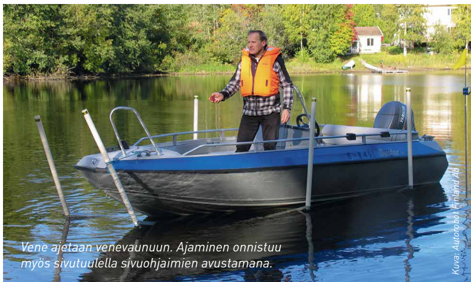
Vene ajetaan venevaunuun. Ajaminen onnistuu myös sivutuulella sivuohjaimien avustamana.