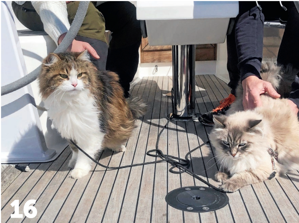
Laiva on lastattu lemmikeillä