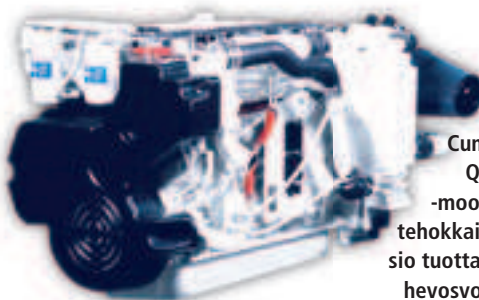
Cummins QSB5.9 -moottorin tehokkain versio tuottaa 425 hevosvoimaa.

Pykälää suuremman, QSC8.3-sarjan uusin tulokas on 500-hevosvoimainen QSC8.3-500. Huvivenekäyttöön tarkoitettuun QSC-sarjan