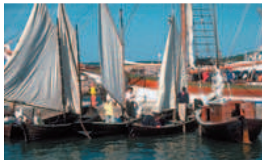
Kustavin rannan valtaa perinteikäs talonpoikaistunnelma heinäkuussa.

Purjehduskilpailun yhteydessä järjestetään koko perheelle suunnattu merenrantatapahtuma. Luvassa on pelimannimusiikkia, käsityönäytöksiä ja perinnetunnelmaa. Lapsille on oma käsityöpaja, jossa lapsia ohjataan askartelemaan luonnonmateriaaleista. Tapahtumaan on ilmainen sisäänpääsy. Lisätietoja tapahtumasta löytyy osoitteesta www.volterkilpikustavissa.org.