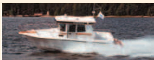
Nord Stareja valmistuu ensi syksystä alkaen uudesta tehtaasta.

tehdään ensi syksystä lähtien yhteensä noin 4 000 neliömetrin tilois-