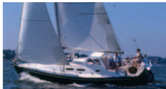
Ensimmäinen vain Finggulf-pursille tarkoitettu kilpailu järjestetään syyskuussa Espoossa.

Kilpailuun voi ilmoittautua Club Finggulfin kautta (www.clubfinggulf.fi).