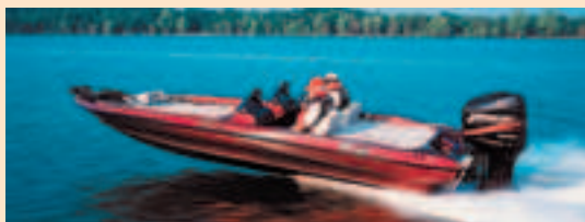
Tritonin Tournament Bass Boat -mallisarjan huipulla on hieman yli 6-metrinen Tr-21 XD.

Lisäksi Brunswick omistaa Mercury Marinen, joka valmistaa muun muassa Mariner- ja Mercury-perämootoreita.