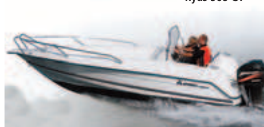
Ryds 568 GT

Suomessa Rydsin vähittäismyynti keskittyy alkuun neljälle paikkakunnalle; Helsinkiin, Tampereelle, Kemiöön ja Maarianhaminaan. Lisätietoja www.vator.com ja www.rydsbatar.se