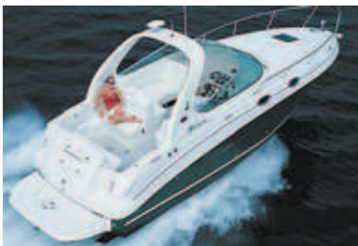
Vuosittainen JD Powerin tutkimus mittaa jenkkiluttajien asiakastyytyväisyyttä. Sea Rayn omistajat osoittivat tutkimuksen mukaan kaikkein suurinta tyytyväisyyttä valintaansa 24–33-jalkaisten matkaveneiden luokassa.

Moottorien osalta Honda arvosteltiin ykkös-sijalle nelitahtiperämoottorien luokassa ennen Yamahaa. Mercury sai ykköstitat kaksitahtiperämoottori- ja sisäperämoottori- (MerCruiser) kategorioissa.