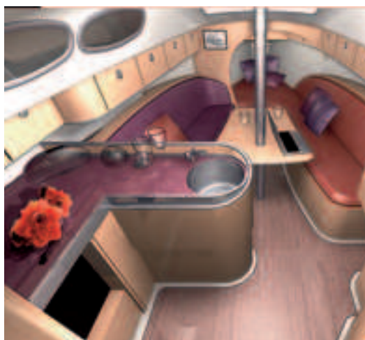
Etap 28s -veneeseen on luvassa rohkeasti muotoiltu ja väritetty sisustus.

Muiden Etap-veneiden tapaan myös uusi 28s on oppoamaton ja siihen saa joko tavanomaisen 1,76 metriä syvän eväkölin tai vaihtoehtoisesti 1,05 metriä syvän tandemkölön. En-