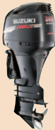
Suzukin uusi DF300 nousee nelitahtiperämootoreiden tehokilvan kärkeen.