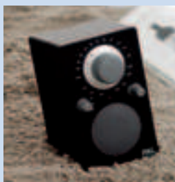
Tivoli Audion PAL -mallit ovat roiskevesisuojuattu ja soveltuvat siten myös hyvin veneilijän radioksi.

teen kosteanakin. Laitteen suojausta voi vielä tehostaa lisävarusteena saatavalla kantolaukulla, jossa on taskut MP3-soittimelle ja kännykälle. PAL-mallit on varustettu laadukkailla NiMH-akuilla, jotka kolmen tunnin pikalatauksella tarjoavat laadukasta ääntä parhaimmillaan yli viikonlopun. PAL-radioita voi myös ladata matkan aikana 12 voltin virtalähteellä, esimerkiksi veneen akulla tai aurinkokennolla. Painoa laitteelle kertyy noin 1,5 kiloa ja sen suositushinta on 199 euroa. Tivoli Audion tuotteita myy pääasiassa radio- ja sisustusliikkeet ympäri maan. Lisätietoja löytyy osoitteesta www.tivoliaudio.fi .