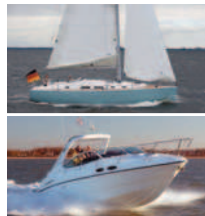
Sealine S29 (alle 9 m moottoriveneet) ja Hanse 400e (alle 12 m purjeveneet) palkittiin luokassaan vuoden veneeksi Euroopassa.

Brunswickin ”talliin” kuuluu nykyisin yli 20 venemerkkiä, joista Suomessa tunnetuimpia ovat esimerkiksi Sea Ray, Bayliner, Sealine, Uttern ja Quicksilver. Yhtymä tunnetaan myös Mercury Marinen (Mariner-, Mercury- ja MerCruiser-moottorit) omistajana. Lisäksi Brunswickilla on osuomistus muun muassa suomalaisesta Bella-Veneet Oy:stä.