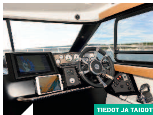
TIEDOT JA TAIDOT

16 Virrankulutus veneissä on haaste, johon voi vastata järkevällä suunnittelulla ja omakohtaisia käyttötottumuksia tutkien. Virtaa ei onneksi tarvitse enää pihistellä, ja vesillä voi nauttia myös mukavuuksista.