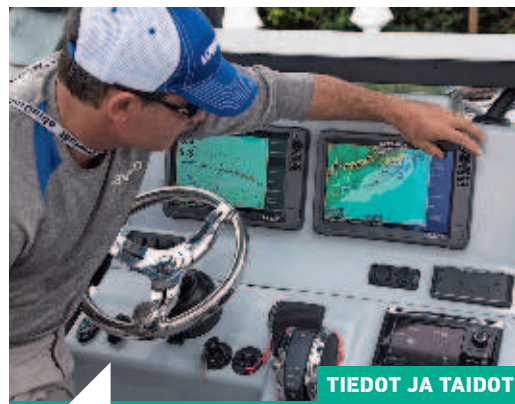
TIEDOT JA TAIDOT

18 Jos et ole ihan sinut gps-plottereiden kanssa, et todellakaan ole yksin. Loppupeleissä niiden haltuunotto ja käyttö on kuitenkin helppoa, kunhan hoksaa tietyt perusasiat. Pehdymme tässä numerossa sähköiseen navigointiin.