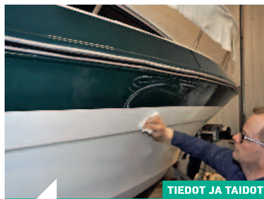
TIEDOT JA TAIDOT

30 Kylkien puunaaminen vahalla ei ole enää ainoa vaihtoehto – uudella TFC-pinnoitteella pinta kirkastuu kevyesti pyyhkimällä eikä nestemäinen kiillote ole levitysolosuhteidenkaan suhteen yhtä kranttu kuin perinteinen vaha.