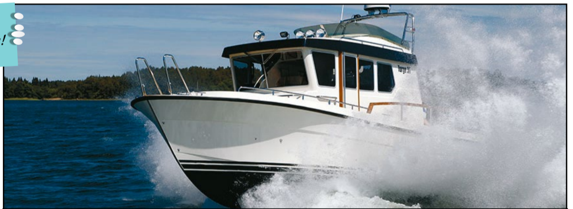
Oy Targa Center Ab, www.targacenter.fi , Aallonmurtaja 1.1-5.5

Alumiiniveneiden isommasta päästä Uivassa on nähtävillä esimerkiksi Finnmaster Husky R8s, Busterin lippulaiva Phantom sekä ensimmäistä kertaa Suomessa esillä oleva Viggo X8.