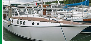
Ansö 31 moottoripurjehtija

teräs, hienokuntoinen ja hyvinvarusteltu. TARJOUS TÄMÄN VIIKON 22 000 €