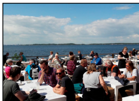
Isosaaren Upseerikerhon terassilta avautuu väljät merimaisemat kohti Helsinkiä.