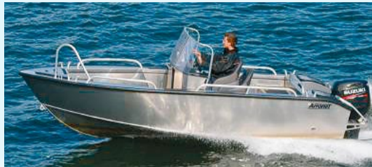
Arronet 18 SPO