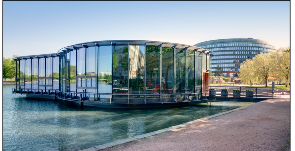
Meripaviljonki on Helsingin ensimmäinen julkinen kelluva rakennus. Ravintolasalin seinät ovat maisemaikkunaa.

Suosituin liuska on Surf & Turf (16,50 eu-