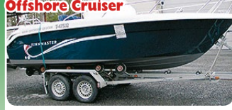
Finnmaster 6500 Offshore Cruiser

2 x MCM 245 hv-99. Vene on hieno. Gene- raattori ym varusteet 39 500 €