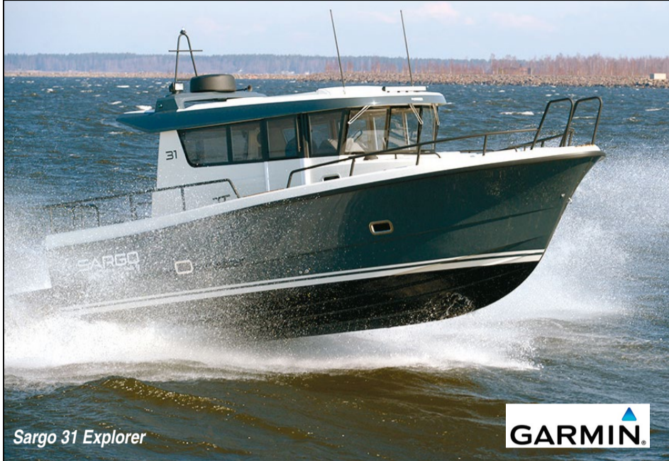
Sargo 31 Explorer

Varaa koeajoaika venenäyttelyssä tai soita Kone Vuorion Sargo myyjille.