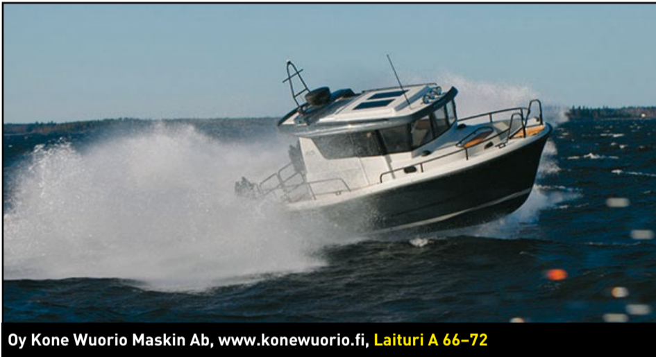
Oy Kone Wuorio Maskin Ab, www.konewuorio.fi, Laituri A 66-72

Uivassa ensiesittelyssä oleva Jeanneau Leader 33 haastaa Grandezza 34 OC:n kymmenmetristen sportcruiserien luokassa.