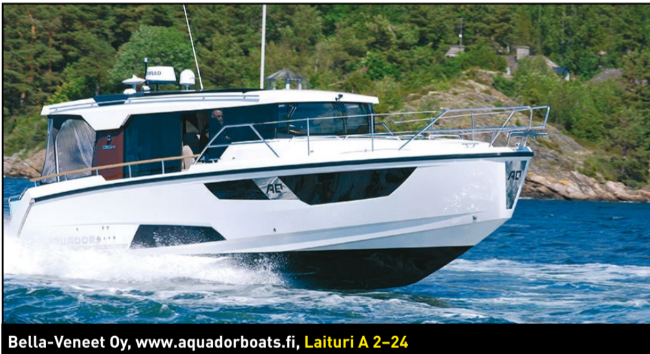
Bella-Veneet Oy, www.aquadorboats.fi, Laituri A 2-24

Sargon koko mallisto on saatavilla vakiomallien lisäksi myös ulkoisesti kustomoituina ja erikoisvarusteltuina Explorer-versioina. Kuvassa malliston pienin Sargo 25 Explorer.