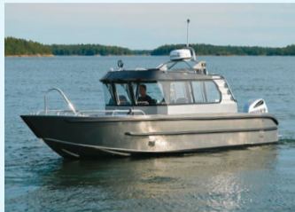
Arronet 23.5 Suprice

Varaa aika Uivassa tai soita Konevuorion Arronet myyjille.