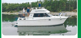
Carver 32 AC

2 x 200 hv Volvo Penta -90. Tilava ja hyvin varusteltu. 59 500 €