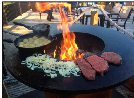
Vendlan erikoisuudet valmistuvat usein avogrillissä.