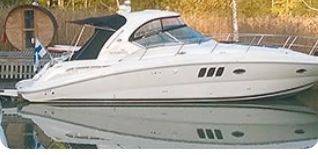
Sea Ray 395 DA

2 x Cummins a 380 hv ZEUS vetolaittein VAIN 370 t. HIENO!! 249 000 €