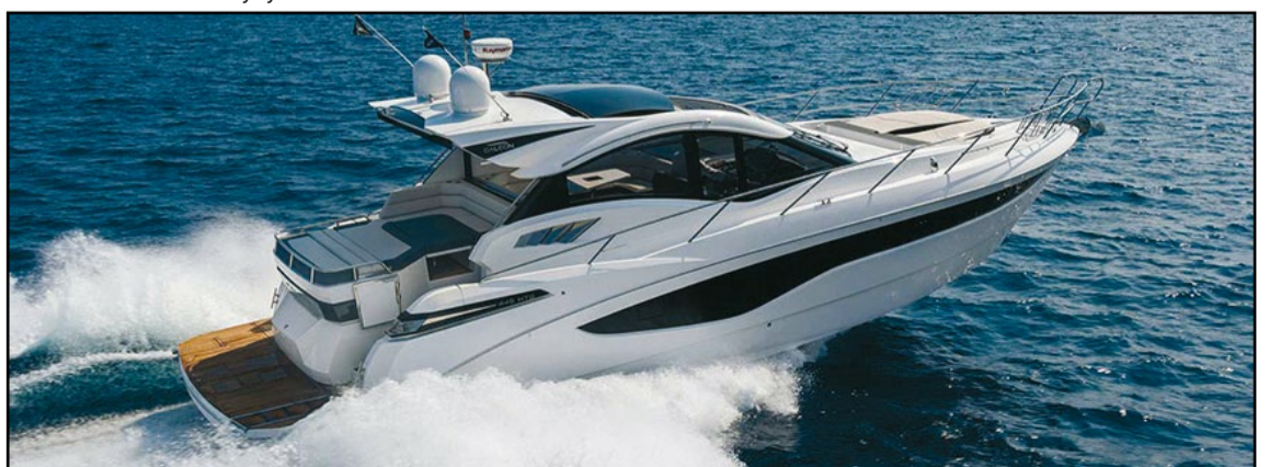
Nordec Nautic Oy, www.nordecnautic.fi , Aallonmurtaja 3

Targan kuluvan vuoden uutuusmalli 30.1 on osoittautunut myyntimenestykseksi. Seuraava täysin uusi Targa-malli tulee korvaamaan nykyisen 27.1:n.