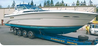
Sea Ray 390 Express Cruiser

2 x 420 hv Caterpillar, moottorit -97. VARUSTELTU. 79 000 €