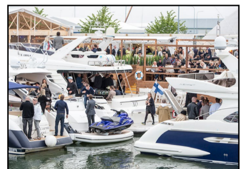
Hernesaaren Rannassa on tavoiteltu välimerenhenkisiä puitteita.