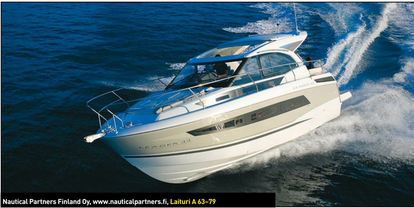
Nautical Partners Finland Oy, www.nauticalpartners.fi, Laituri A 63-79

Uivassa ensiesittelyssä oleva Jeanneau Leader 33 haastaa Grandezza 34 OC:n kymmenmetristen sportcruiserien luokassa.