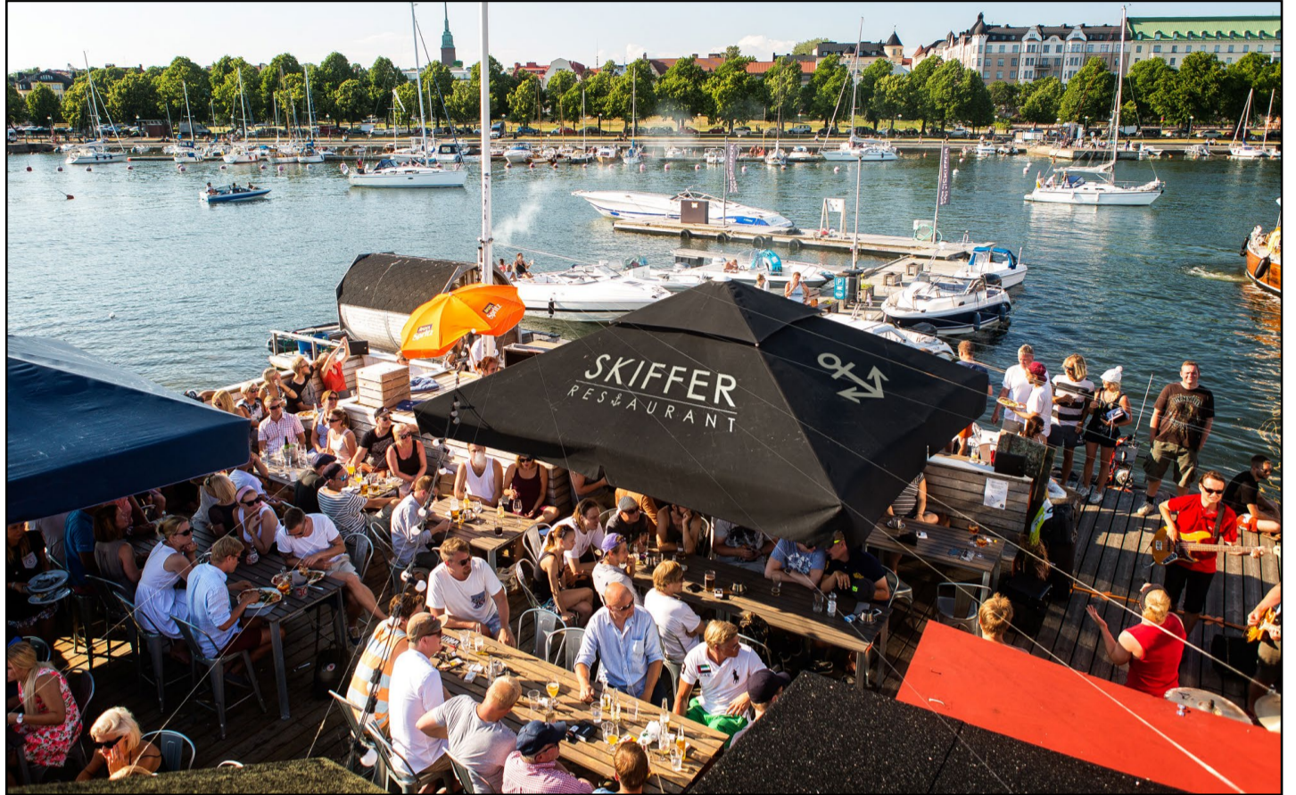
Skifferin terassi vetää kesäkeleillä väkeä. Muuta vaihtoehtoa ei olekaan, sillä sisätiloja ravintolalla ei ole.

Kiinnostavuutta lisäävät keikkatapahtumat ja monipuoliset mahdollisuudet isom-