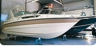
Chaparral 29 Signature

2 x MCM 245 hv-99. Vene on hieno. Gene- raattori ym varusteet 39 500 €