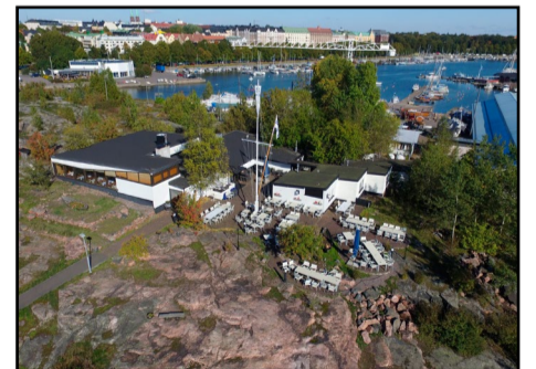
Ravintola Saari terasseineen on kalliosaaren laella.