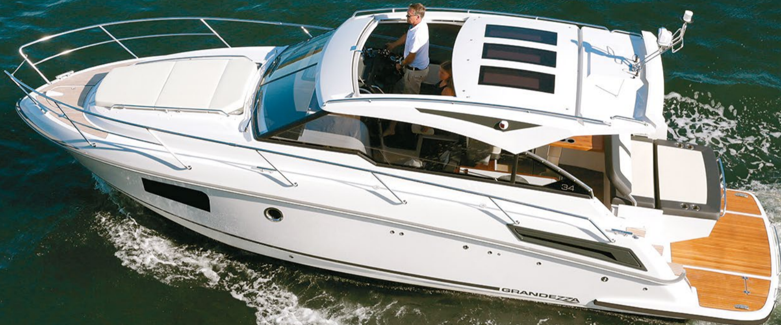
Astrum Vene Oy, www.astrum.fi , Laituri A 76-82

Grandezza 34 OC:ssa on edeltäjänsä verrattuna muun muassa entistä suuremmat runkoikkunat, pidempi uimataso ja muunneltava peräsohva.