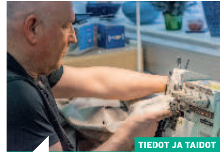
TIEDOT JA TAIDOT

36 Jos aikansa eläneet venepatjat kaipaavat päivitystä, voi tilaamisen sijaan osallistua itse verhoilukurssille, vaikkei tietäisi verhoilusta tai ompelukoneista tuon taivaallista. Kurssilla saa materiaalit, kädestä pitäen neuvot ja ohjeet suoraan opettajalta. Lisäksi voi työskennellä ammattilaisen työvälineillä.