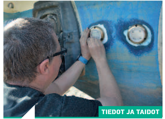
TIEDOT JA TAIDOT

36 Vedenalaiset valot luovat omanlaistaan tunnelmaa veneen ympärille ja sanotaanpa jopa kalojen lumoutuvan niistä sikseen, että käyvät paremmin syöttiin. Yhtä kaikki valojen asentaminen on varsin helppo homma. Katso kuvasarja.